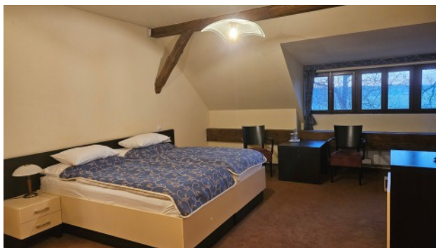
Zimmerbeispiel - Dependance

Gegen Mittag treten wir, voller wundervoller Eindrücke, die Heimreise an, um am Nachmittag wieder in Meerane, Zwickau und Werdau zu sein.