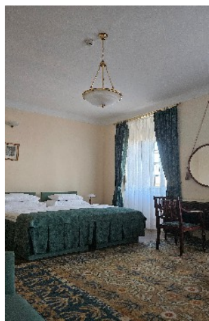
Zimmerbeispiel - Schlosszimmer

Mit einem Glas Sekt und Blick auf den Schlosspark begrüßen wir das Jahr 2027.